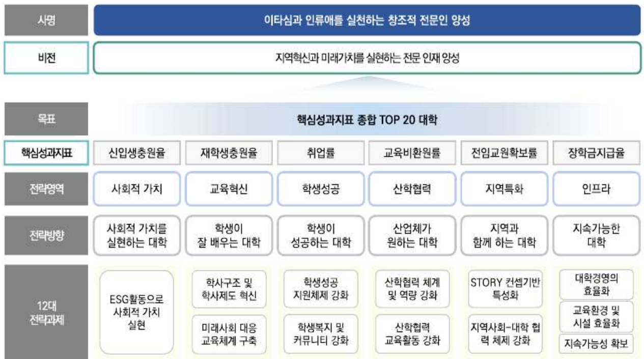
[그림 1] 문경대학교 MKC 발전계획 E-VALUE UP+ 2029 비전 및 추진 전략